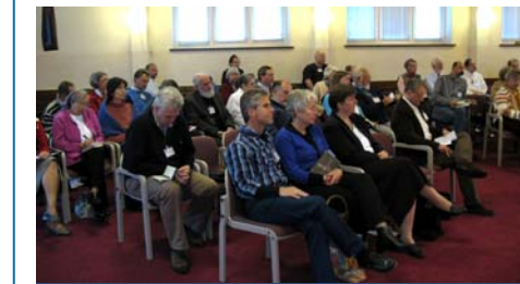
Eerste TJC-II Europese Conferentie

ongeveer duizend zijn verenigd in Messiaans Joodse gemeentes). Ze zijn zeer actief, hebben een eigen krant (in Duits en in Russisch) en zijn ook bezig met het ontwikkelen van academische vorming.