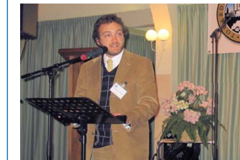
Eerste TJCII Europese Conferentie 22-25 oktober 2007