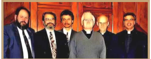
TJC-II leiders ontmoeten de bisschop van Northampton, Engeland in 1997