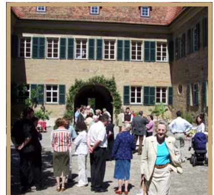
Deelnemers bij het kasteel Castell nabij Würzburg, Duitsland