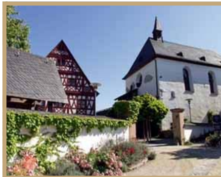
Plaats van de TJC-II Internationale leidersbijeenkomst in september.

Gastheer in Duitsland zal de "Jesus Brüderschaft" zijn. Deze geloofsgemeenschap is in het begin van de vijftiger jaren gesticht door een Luthers echtpaar in een oud klooster, als antwoord op Gods oproep tot berouw en geestelijke vernieuwing in het Duitsland van na de verschrikkingen van de