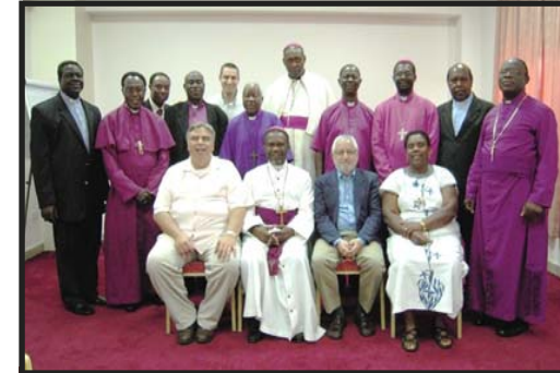
Vorbidders in Accra, Ghana