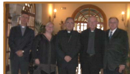
TJC-II groep met de aartsbisschop van Sevilla in zijn kantoor.

Tijdens een andere voorbedenactie in mei 2011, die niet direct verbonden was met TJC-II, werd een profetisch woord ontvangen: "Proclameer leven." Waar we ook gaan moeten we leven proclameren. We moeten op plaatsen van dood leven proclameren, een vrucht van het kruis en de opstanding van Jezus. Deze proclamatie van het leven zorgt er dan voor dat de genaden en zegeningen uit het verleden opnieuw opgepakt kunnen worden en dat daarop verder gebouwd kan worden. Toen ik dit woord hoorde, voelde ik aan dat dit woord ons een vierde stap aanreikte die het proces van genezing completeert, want verootmoediging is altijd "nieuw leven". (Hand. 11:18).