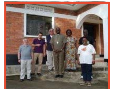
Bezoekers met Afrikaanse voorbidders groep