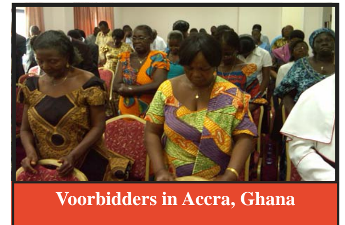
Voorbidders in Accra, Ghana

Van Nairobi vlogen we naar Entebbe in Oeganda en de volgende dag maakten we een reis van zes uur per auto, waarbij we de Nijl overstaken, naar een kamp ver weg in het land in een plaats genaamd Nebbi. Daar ontmoetten we de Anglicaanse aartsbisschop en zijn vrouw, die er op retraite waren. De aartsbisschop had anderhalve dag voor ons uitgetrokken. Hij is een geweldige man, met een groot hart, vervuld van de Heilige Geest. Hij bezoekt Israël regelmatig en heeft de Anglicaanse priester van de ChristChurch (Jeruzalem) gewijd, waar ook onze Messiaanse gemeente al bijna 24 jaar haar samenkomsten houdt. Hij houdt van het Joodse volk en het land Israël. Ik was zo gezegend dat ik mijn 70e verjaardag in zijn huis in Nebbi mocht vieren. Ik ervoer daarin de goedheid en de trouw van de Heer.