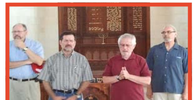
Voor het altaar in Christ Church.