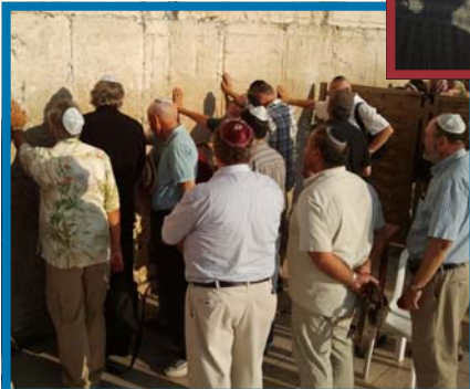
Leden van het TJC-II Internationale Comité bidden bij de Westelijke