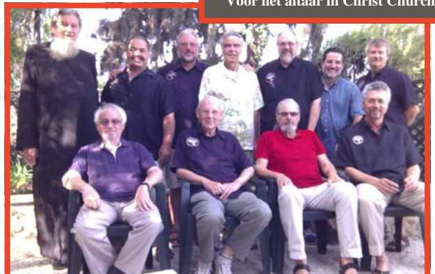
Het TJC-II Internationale Comité in Jeruzalem oktober 2012