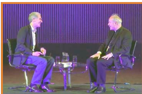
Pastor Nicky Gumbel en Kardinaal Christoph Schönborn

Een leiderschapsconferentie die gehouden wordt door een locale Anglicaanse gemeente in het centrum van London lijkt niet direct een geweldige kans in te luiden voor allen die een hart hebben voor de visie van TJC-II. Maar de Holy Trinity Brompton (HTB) in de sjeke wijk Knightsbridge, is geen gewone plaatselijke gemeente . Het is een gemeente waar op zondag elf verschillende gemeenschappen hun diensten houden en van waaruit een hele serie gemeentes gesticht is in de hoofdstad. Het is ook de geboorteplaats van de Alpha Cursus, een inleiding in het Christendom, die in 163 landen gegeven wordt, en waar al meer dan 22 miljoen mensen aan deelgenomen hebben. HTB is zeker de meest invloedrijke gemeente in het Verenigd Koninkrijk.