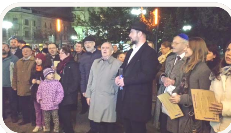
Buiten bij de stadsschouwburg in Oradea tijdens de havdala-dienst bij het afsluiten van de sjabbat