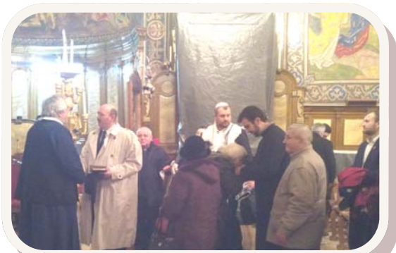
In de Orthodoxe kathedraal

De zevende dag van de Oecumenische Week van Gebed was in de Messiaans-Joodse gemeente in Oradea, in onze synagoge. We kwamen samen met gelovigen en priesters van de Rooms-katholieke, Grieks-orthodoxe, gereformeerde, Lutherse en Unitarische kerken. Daarbij waren onder onze gasten en sprekers ook pinkstervoorgangers en charismatische voorgangers en andere priesters en dominees.