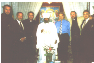
Leden van het IC met een Ethiopische koptische leider

Jeruzalem 2006 was een opwindende bijeenkomst. De visie van TJC-II werd verwelkomd door de broeders van de "Jerusalem Olive Tree Fellowship" (die later geassocieerd is met TJC-II). Er was een sterk gevoel dat dingen op hun plek kwamen. Velen werden de ogen geopend voor de heerlijkheid van de visie van TJC-II en voelden het alomvattende karakter van de visie (alle Joodse gelovigen in Jesjoea en alle kerken van de volkeren) en de betekenis ervan voor de eindtijd.