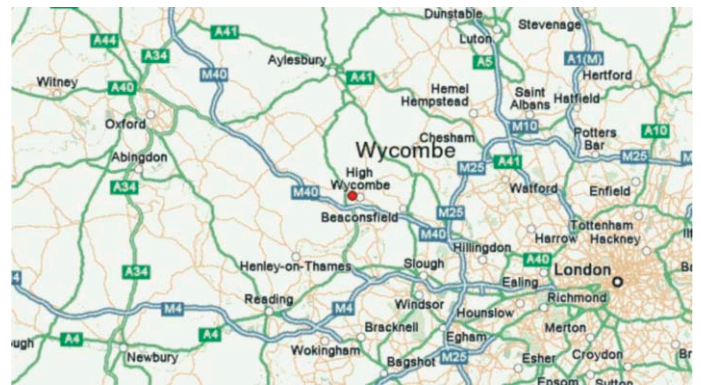
High Wycombe, tussen Londen en Oxford