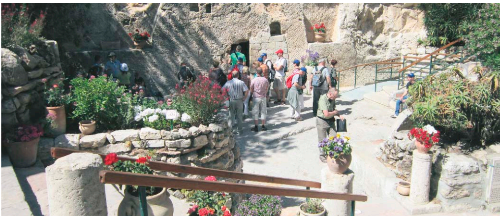
De graftuin in Jeruzalem

Wat is het Paasgeloof en hoe draagt dat bij aan de visie en het mandaat van TJC-II? Het paasgeloof bestaat niet uit het simpelweg geloven dat Jezus fysiek uit de dood is opgestaan. Dat is een bewezen historisch feit. Geen enkele hoeveelheid "nepnieuws" van Pilatus of het Sanhedrin was in staat om de eenvoudige waarheid te ontkennen dat het graf leeg was op die eerste Paasdag. Nee, het paasgeloof begint met een ontmoeting met de verrezen Jezus die leidt tot een persoonlijk geloof en een leven van wat Dietrich Bonhoeffer 'discipelschap met een hoge prijs' noemde. Jezus nodigt ons uit om Hem te volgen, niet om onze eigen dromen te vervullen, maar om aan onszelf te sterven en Gods doelen te omarmen.