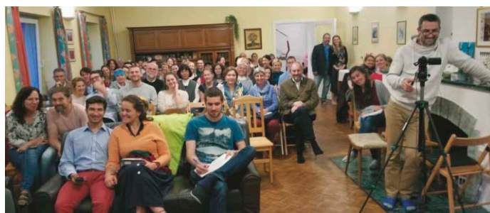
De start van het Vormingsprogramma in Hainburg

We geloven dat 2020 zelfs nog beter zal zijn! We verlangen ernaar nog meer mensen te bereiken met de boodschap van verzoening van Gods volk wereldwijd. Zou u biddend willen overwegen om een gift over te maken, zodat we deze vitale boodschap van eenheid in het hele Lichaam van de Messias kunnen blijven verspreiden? We stellen uw deelname erg op prijs! TJC-II is dankbaar voor uw ondersteuning.