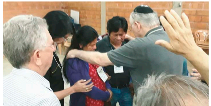
Bidden voor een echtpaar uit het Amazonegebied